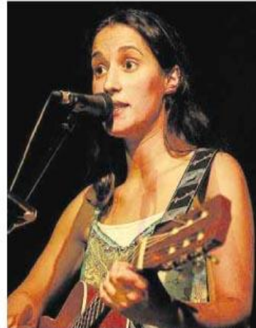
Les bonnes chansons réalistes de Thérèse sont désormais à déguster sur un DVD.

« Le pire serait qu'il n'arrive jamais rien », chante Thérèse